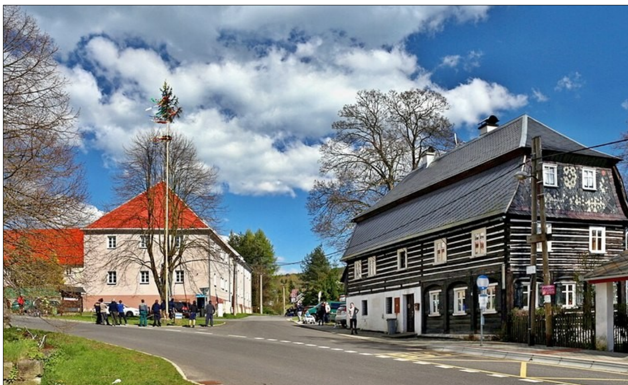
Náves v Krompachu

Krompach je malebná horská obec ležící jen sedm kilometrů severovýchodně od Cvikova. Rozprostírá se mezi vrchy Hvozd a Plešivec, přímo na historické obchodní stezce do Žitavy. Tuto obec, hraničící se Saskem, tvoří tři části – Krompach, Valy a Juliovka – a nabízí návštěvníkům nejen klid a krásu přírody, ale i pohled do minulosti.