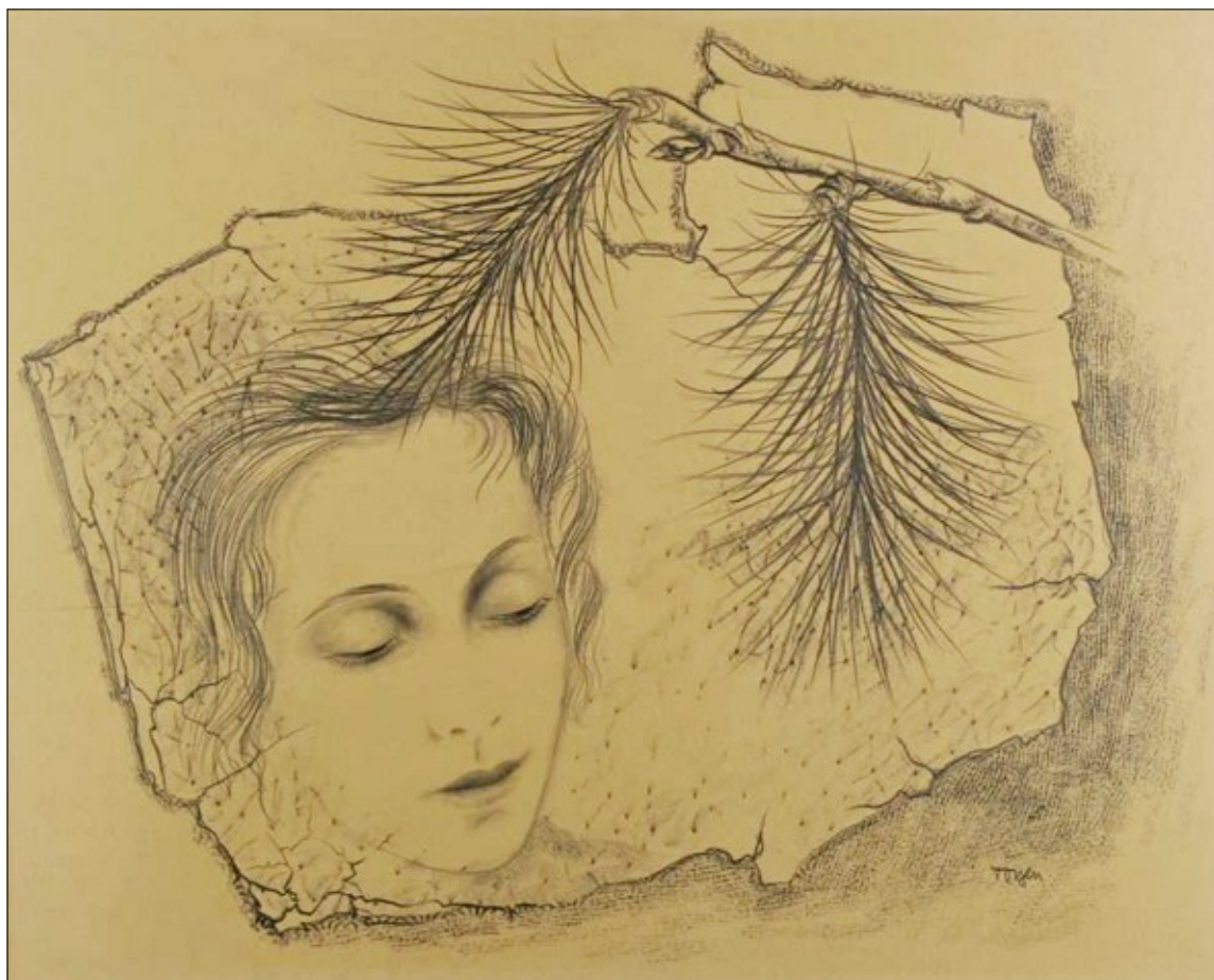
Toyen: Dívčí hlava, 30. léta

„Chtěla jsem spíš představit příběhy významných českých umělců, které válka nějak zasáhla,“ řekla kurátorka. Za příklad uvedla vztah Čapka a Filly, kteří sice byli podle ní profesně rivalové, ale jejich postoj vůči fašismu byl stejný. „Oba se zapojili do boje proti nastupujícímu nacismu a oba také skončili ve stejném koncentračním táboře,“ uvedla Kubišová.