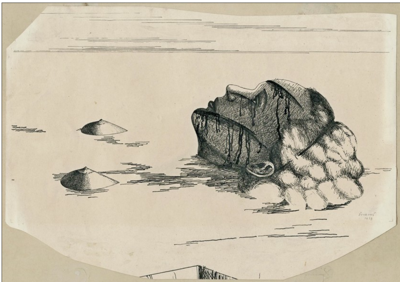
Jindřich Štyrský Dívka zamrzlá v ledu, 1939

Upozornila i na kresby a obrazy Jaroslava Krále, které na výstavu zapůjčila jeho rodina. „Návštěvníci tu najdou například kresby, které byly tajně vyneseny z vězení Královým spoluvězněm. Ten je podepsal svým jménem, aby obelstil gestapo a doručil je rodině,“ dodala Kubišová.