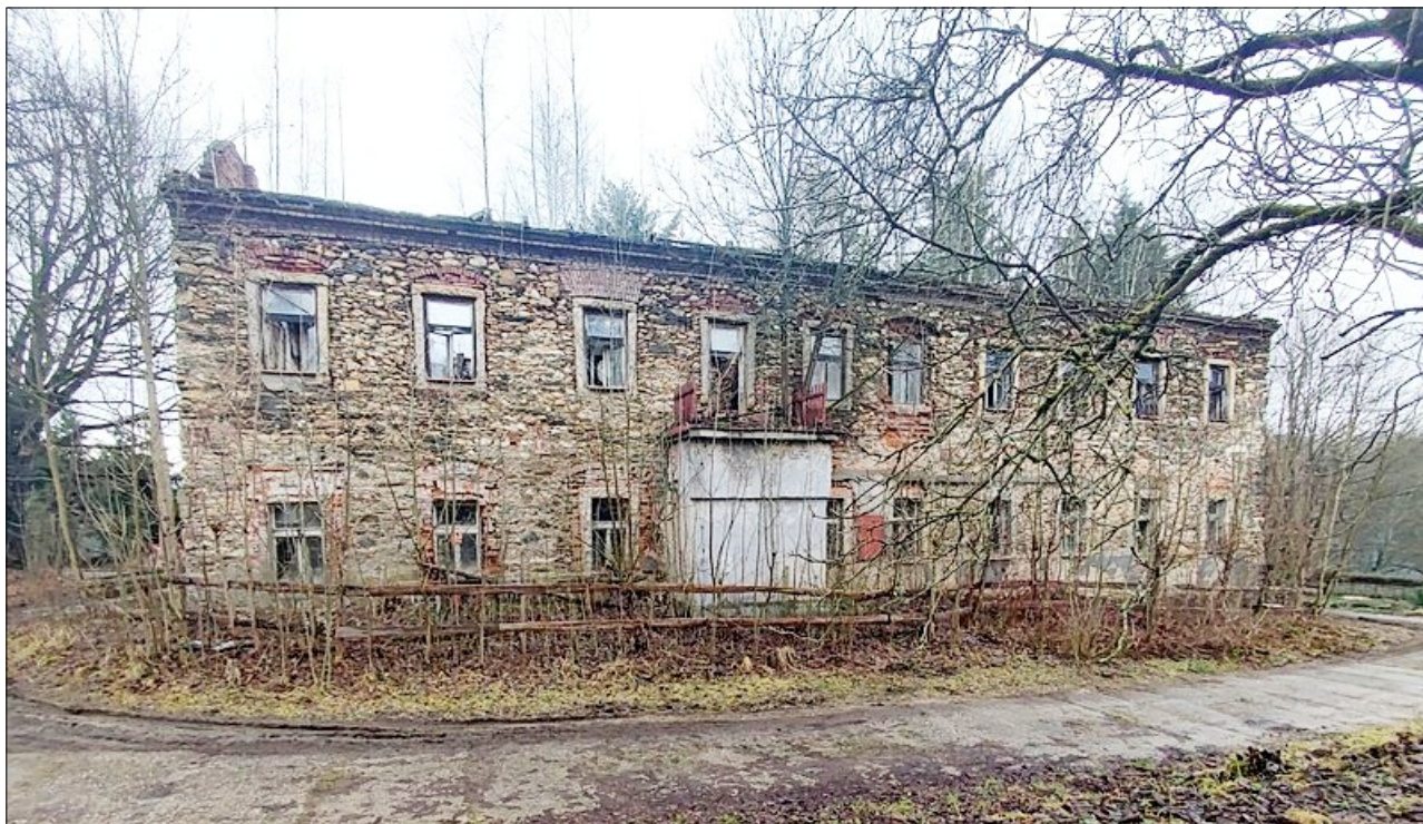
Jesenný – v roce 2007 vyhořelý zámek

Přestože kontaminované pozemky nejsou obecní, ale státní a soukromé, nechala obec zpracovat analýzu rizik a aktuálně nechává zpracovat studii proveditelnosti nápravných opatření, která by měla staré znečištění odstranit. „Už nás to stálo přes pět milionů,“ poznamenal Hlůže. Na obě studie získala obec dotace z evropských fondů a Libereckého kraje. Náklady na sanaci se odhadují na desítky milionů, bez dotací je ale malá obec s 500 obyvateli nebude schopná zaplatit. (Náš REGION)