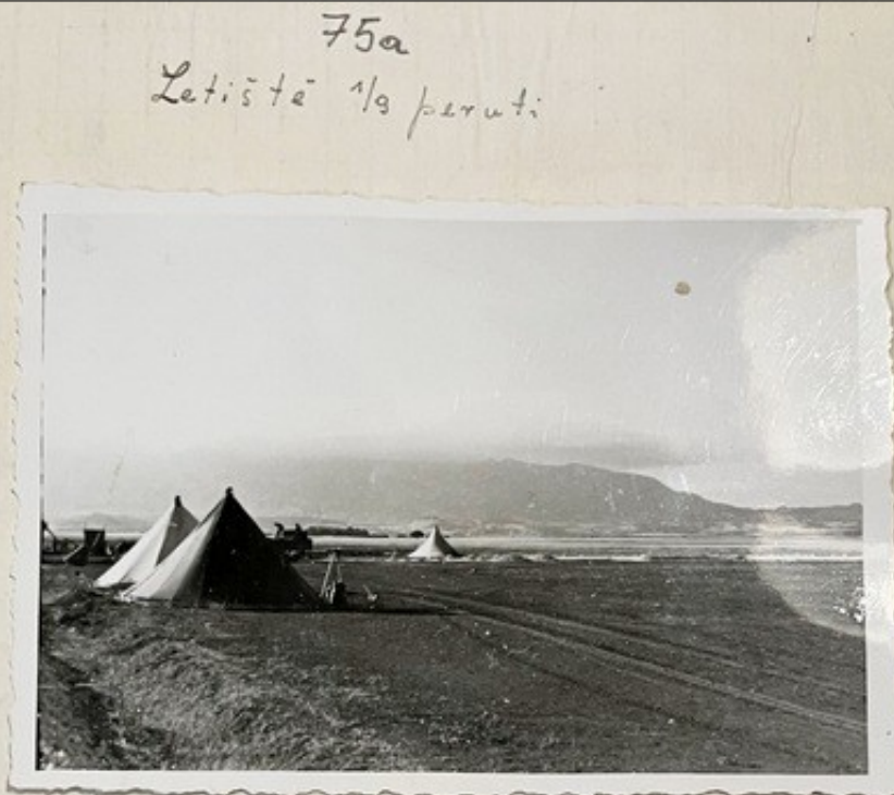
Sepienne. AFRIKA (Tunisie) -