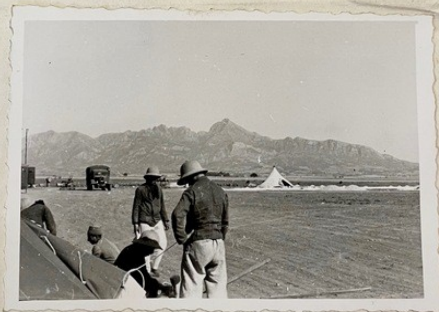
Arabská dělníci jí jasně.