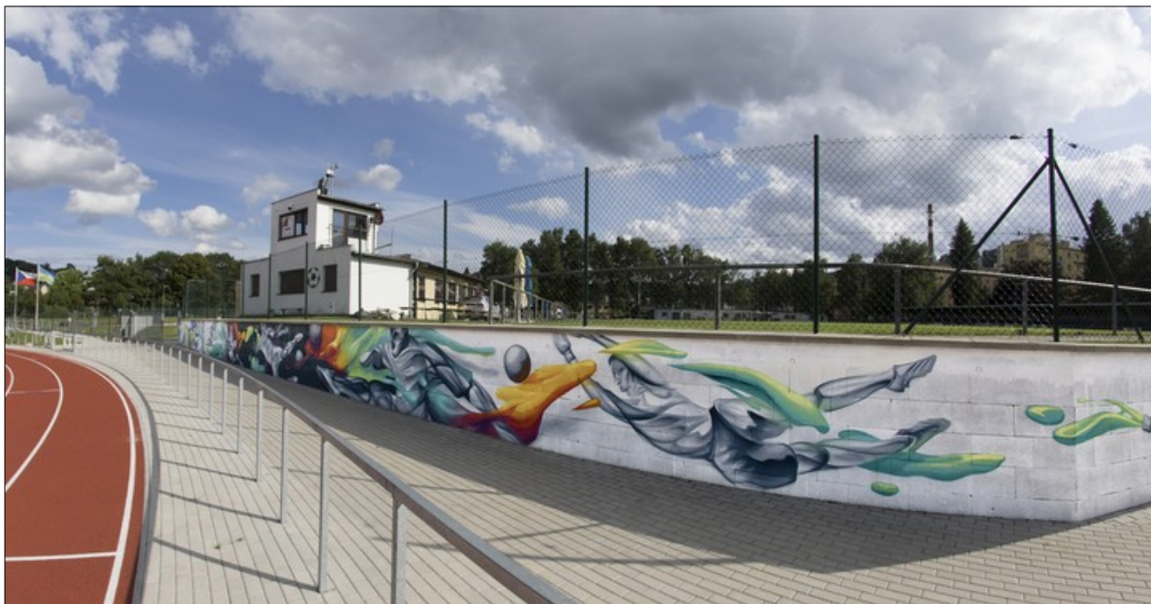
Graffiti na městském stadionu v Semilech.