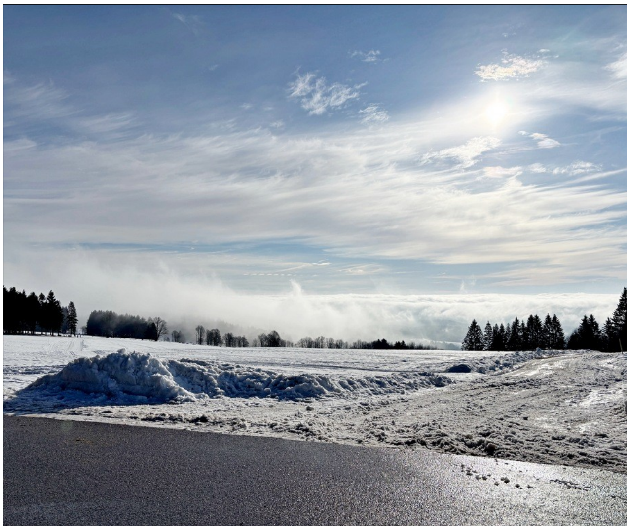
Motiv z Bedřichova