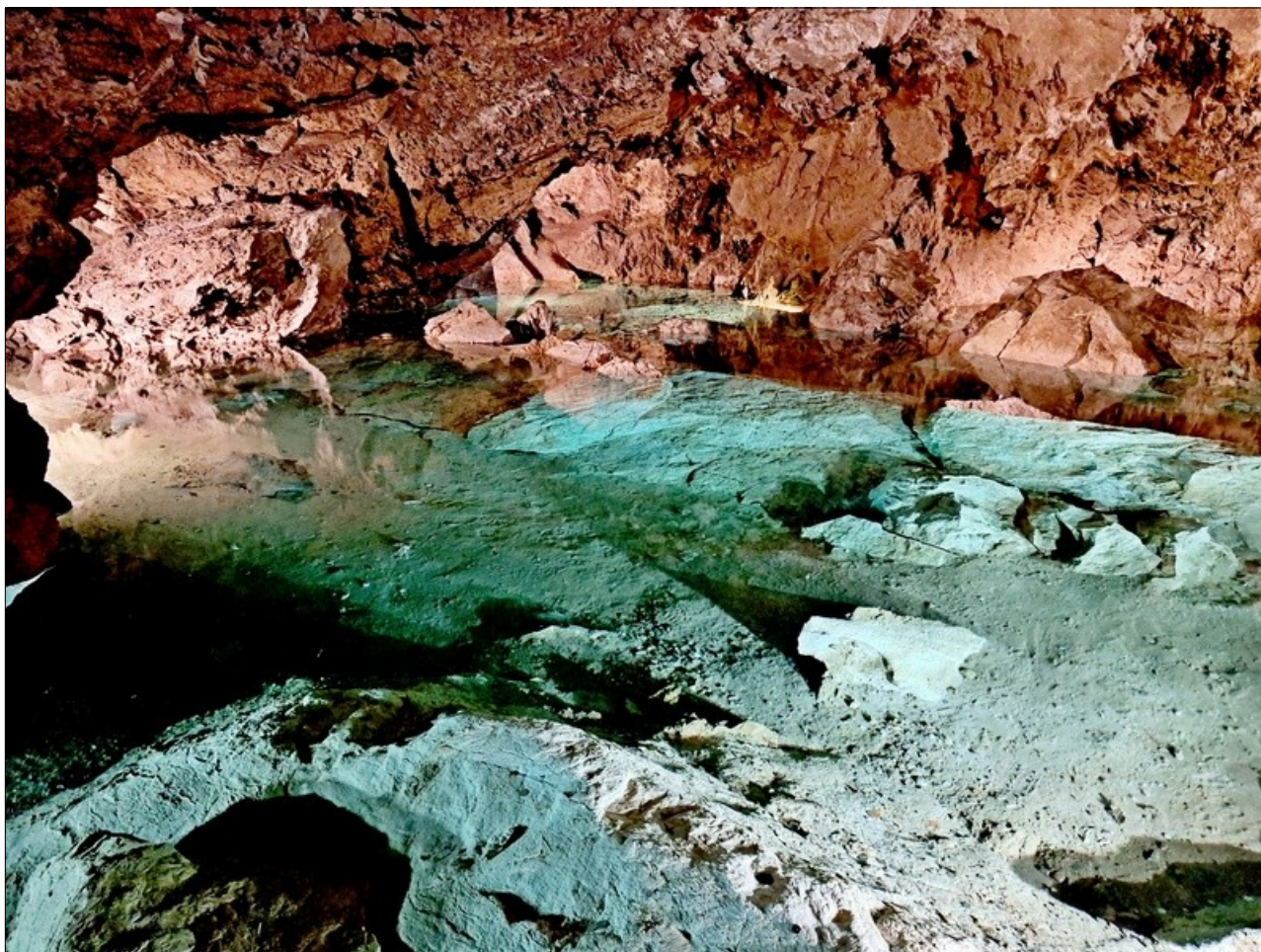
foto Bozkovské dolomitové jeskyně

⌘ Bozkovské dolomitové jeskyně v Podkrkonoší od letoška otevírají v březnu krom všedních dnů také v soboty a neděle mezi 9. a 15. hodinou. Zajímavostí Bozkovských jeskyní s největším podzemním jezerem Čech je netradiční geologický původ – narozdíl od většiny vápencových jeskyní vznikly v odolnějších dolomitech. Charakteristickým rysem jsou křemenné římsy a lišty, které vyčnívají ze stěn a stropů. Kromě tyrkysového podzemního jezera zaujme z výzdoby například Peklo, Prušácká přilba nebo Betlém.