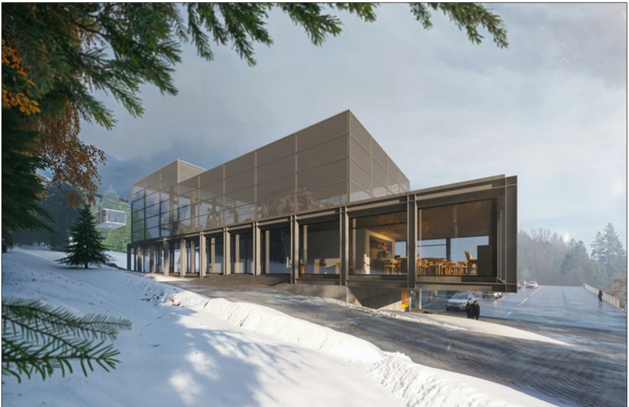
Vizualizace budoucí lanovky.