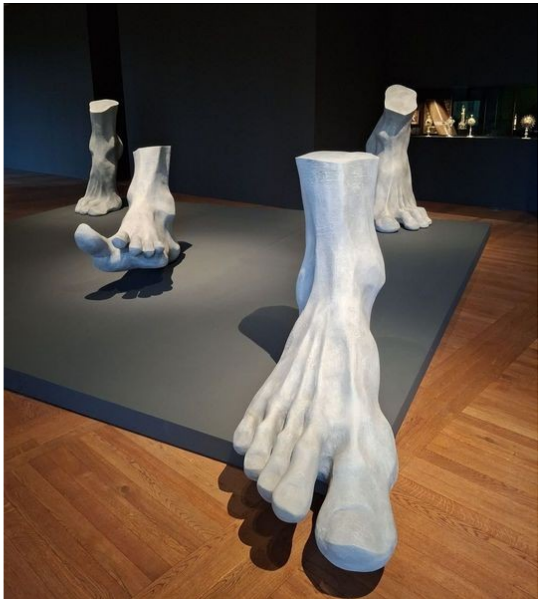
Instalace Magdaleny Jetelové