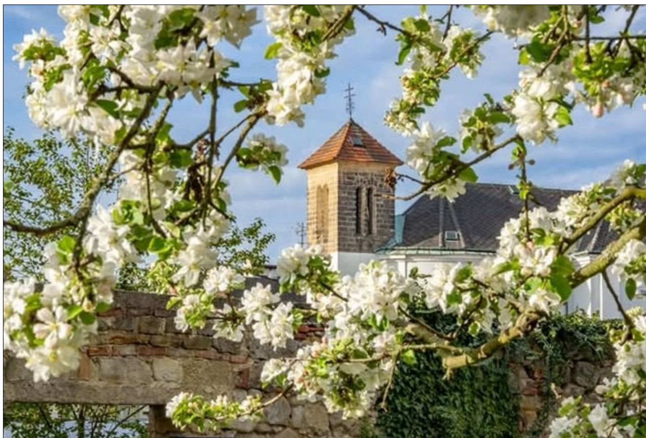
Jaro v Turnově