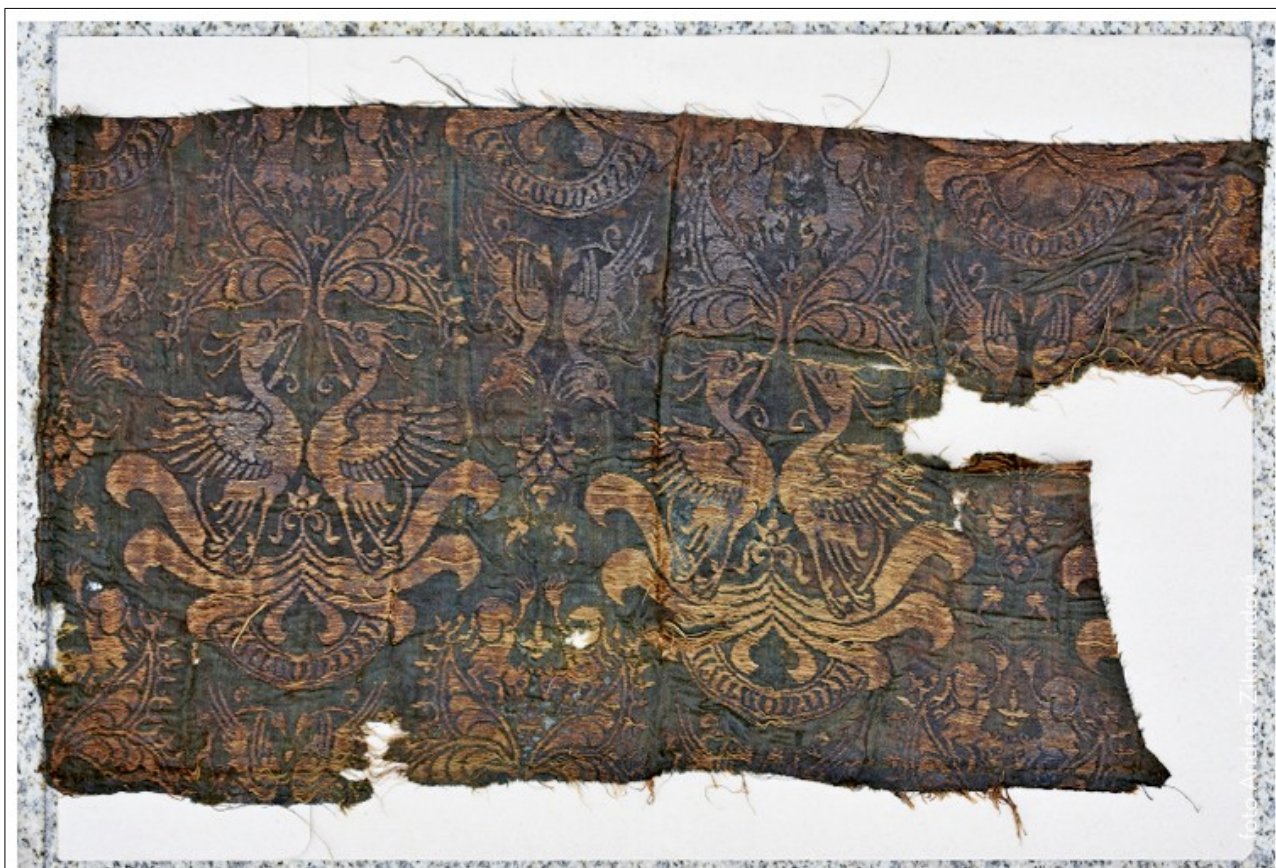
Torzo pohřebního roucha krále Jiřího z Poděbrad, které se nachází ve sbírkách lomnického muzea, bude od nové výstavní sezóny k vidění ve stálé expozici

Následně zhotovená replika kompletního pohřebního roucha krále Jiřího z Poděbrad je dnes k vidění ve stálé expozici Příběh Pražského hradu. Popisovaná historická tkanina si zachovala zelenou barevnost s dobře patrným kovovým útkem. Dominantním opakujícím se motivem je dvojice k sobě obrácených fénixů (bajných zvířat) na neúplné palmetě s páskou a pseudoarabským písmem. Fénixové drží v zobáčích stvol, z něhož vyrůstá dvojice listů. Pravděpodobnou provenienci výroby lze zařadit do oblasti Itálie v období poslední čtvrtiny 14. století. Konkrétně se jedná o svrchní látku dalmatiky z hedvábí. Tkanina byla poprvé v odborné literatuře zmíněna v roce 1906 a v současné době se její části nacházejí v řadě institucí jak u nás (ve sbírkách Pražského hradu, v Národním muzeu, Uměleckoprůmyslovém muzeu v Praze, Hrdličkově muzeu Přírodovědecké fakulty UK), tak v zahraničí (Germanisches Nationalmuseum, Norimberk). V této exkluzivní společnosti renomovaných institucí se poněkud překvapivě nachází tedy i Městské muzeum a galerie Lomnice nad Popelkou.