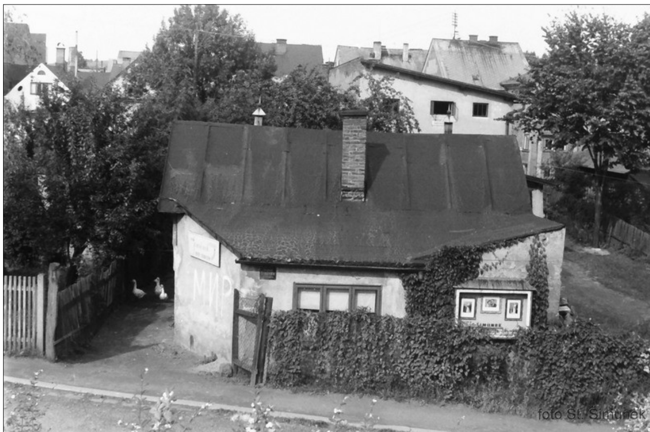
Šimůnkův jilemnický ateliér

momentky ze života občanů Jilemnice a okolí. Cenným dokumentem jsou také celkové pohledy na město, jednotlivé ulice a stavby, které již zanikly nebo postupem času dostaly jiný stavební charakter.